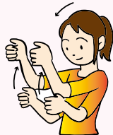
そつぎょうしき 【卒業式】

おやゆび ひとさしゆび 親指を人差し指にのせた りょうていぶし あたま 両手拳を頭を下げなが ら揃えて上げる