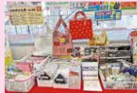
鶴間駅前郵便局設置の様子