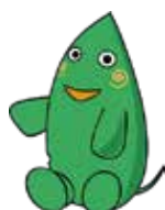
大和市イベントキャラクター「ヤマトン」