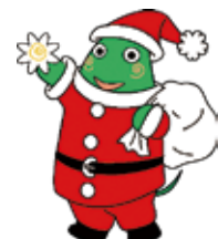
大和市イベントキャラクター「ヤマトン」