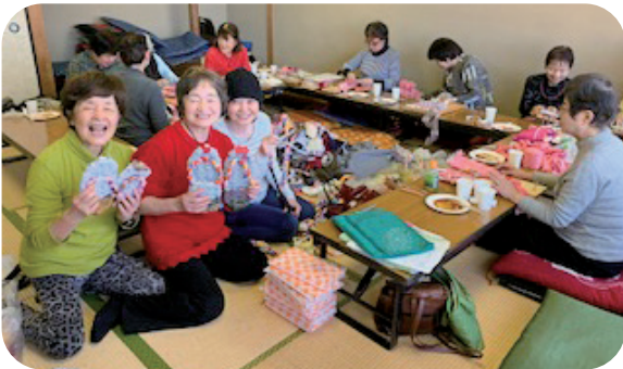
裂き布草履作り風景