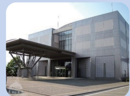
・防災施設の見学(予定)など随時追加予定☆