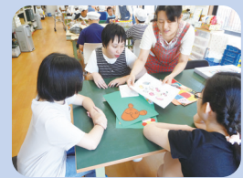
・障がい者施設での体験(予定)