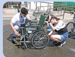
・車イス清掃体験(予定)