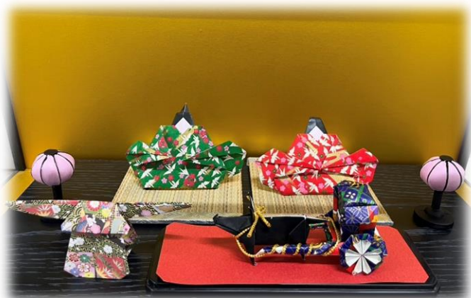
「工作・折り紙 おりひめ」 の作品