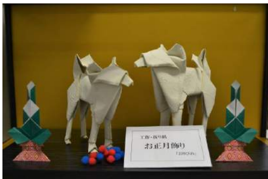
工作・折り紙 おりひめ