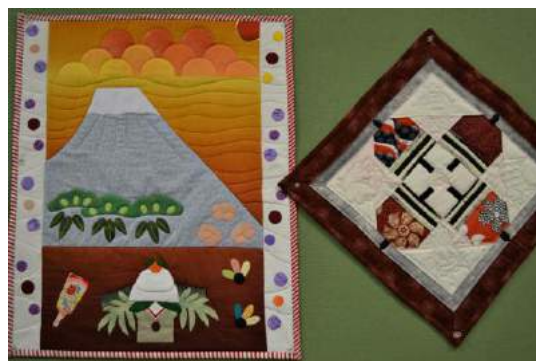
やまとキルトボランティアの会