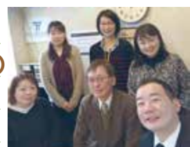
● FM やまとで PR

毎月第4火曜日午前9時 FM やまと (77.7MHz) 朝ラジ ホットスクラン ブル出演中