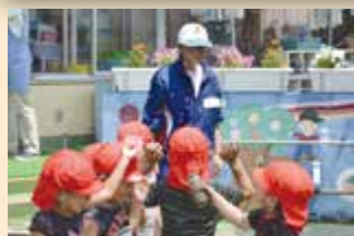
● 中高生ボランティア入門体験中