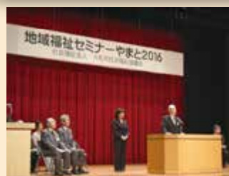
● 地域福祉セミナーやまと