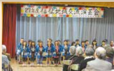
● お年寄りと保育園児との交流