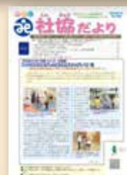
● やまと社協だより