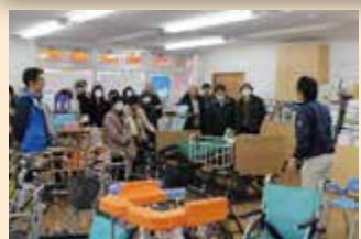
● 地域福祉活動見学会