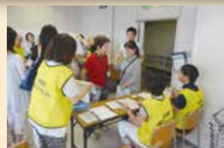
● 災害ボランティアセンター設置運営訓練中

毎月第4火曜日午前9時 FM やまと (77.7MHz) 朝ラジ ホットスクラン ブル出演中